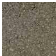
ゼロライトブラウン