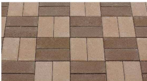
バケット 模様 (ベージュ・茶)