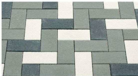
フィッシュボーン ランダム (グレー・白・黒) (4:2:1)