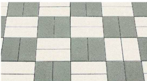
バケット 模様 (グレー・白)