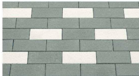
ブリック 模様 (グレー・白)