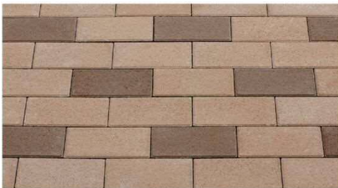
ブリック 模様 (ベージュ・茶)